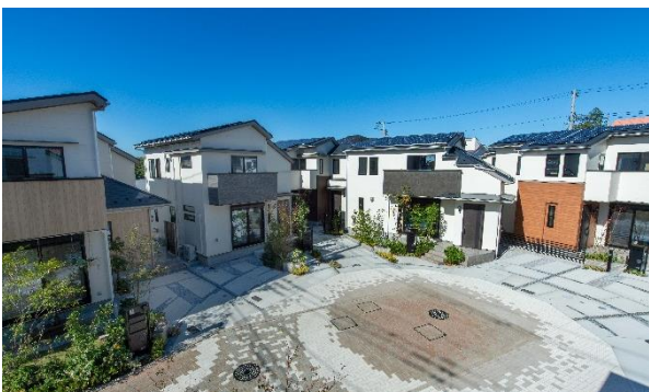
分譲戸建代表物件「リーフィア狛江 蒼翠の街」

今後、その他の新築分譲戸建て計画や既存の戸建てにおいても順次拡大していく見込みです。